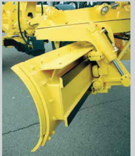
Hydraulische, stufenlose Schnittwinkelverstellung