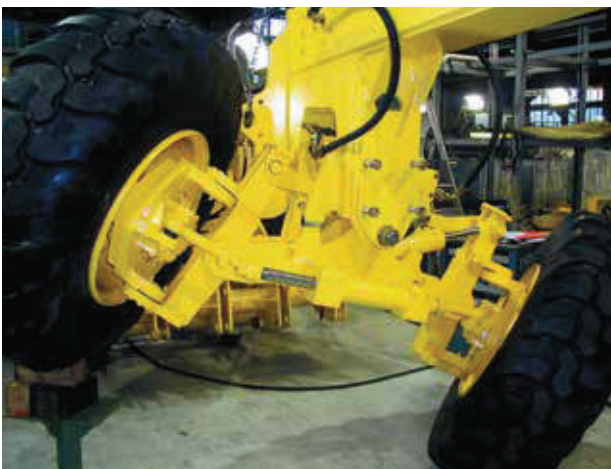
Angetriebene Vorderachse mit Radsturzverstellung