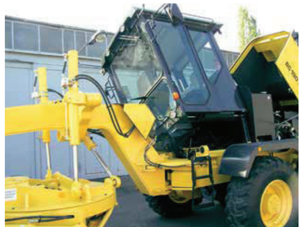
Gute Wartungszugänglichkeit: Kabine und Motorhaube kippbar