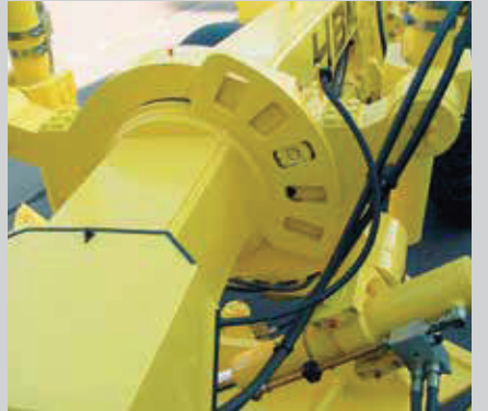
Verstelljoch für Böschungs- und Grabenarbeiten