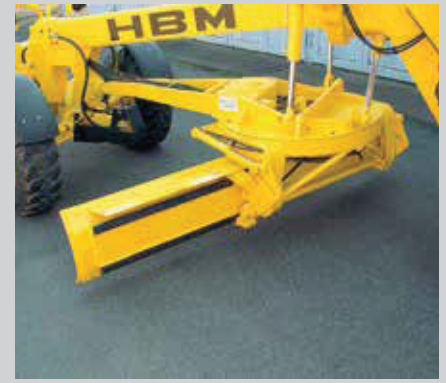
Ausgefeilte Kinematik für schnelles Einstellen der gewünschten Scharposition

Die Load-Sensing-Hydraulik und das direkt vor dem Fahrer befindliche Bedienpult ermöglichen feinfühliges Bedienen aller Scharbewegungen. Das hydraulisch bedienbare Schwenkjoch mit einem Scharverstellbereich von 90° nach rechts und links bringt besten Einsatz im Böschung- und Grabenbereich. Eine serienmäßige Überlastkupplung im Drehkranzgetriebe schützt die Schar vor Beschädigungen. Der Rollendrehkranz ist spielfrei gelagert und garantiert höchste Präzision beim Feinplanum. Weitere Vorteile sind leichtgängige Drehbewegungen mit hoher Drehmomentübertragung. Die hydraulische Schnittwinkelverstellung sorgt für beste Anpassung an den Material-Rollwiderstand. Die Scharführungsleisten aus Spezialstahl (Hardox) sind horizontal und vertikal nachstellbar. Automatische Differential-Sperren in den angetriebenen Achsen – bei den Allradgradern auch zwischen Vorder- und Hinterachsen – sorgen für optimale Schubkraft. Beste Kraftübertragung erfolgt durch außenliegende Planetengetriebe in den Rädern.