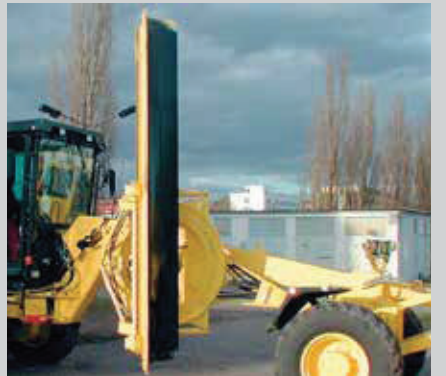
Drehkranz geschlossen, rollengelagert, Böschungswinkel 90° rechts und links