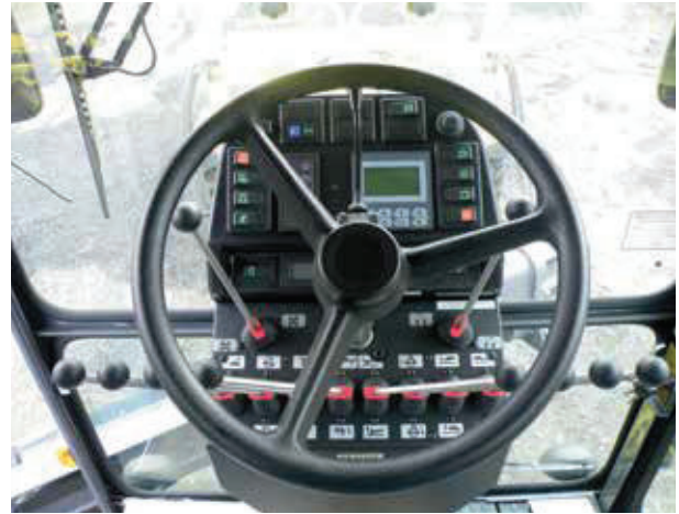
Gute Sicht nach allen Seiten mit verstellbarem Euro-Steuerpult, NAIS-(Gestänge) oder Joystick-Steuerpult auf Wunsch