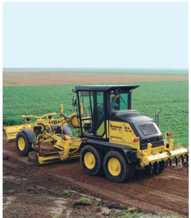
BG 110 TA-4, der kompakte Tandem-Grader, ideal für kleine und mittlere Baustellen.

Mit 6/1 Gewichtsklassen und der Wahl zwischen Tandem- oder Allradantrieb für die meisten Gradertypen bietet HBM den richtigen Grader für jeden Einsatzzweck: Die Grader BG 70 und BG 110 sind ideal für kompakte Baustellen innerorts, Radwege- und Sportstättenbau sowie Garten- und Landschaftsbau. Die mittleren 3-Achs-Typen BG 130 und BG 160 sind die Universalmaschinen für den Straßenbau. Die großen 3-Achsler BG 190 und BG 240 sind die kraftvollen Maschinen für große Einsätze wie Autobahn- und Flugplatzbau sowie den Tagebaueinsatz und die Forstwirtschaft. Durch eine große Zahl von Zusatzausrüstungen können die unterschiedlichsten Einsatzfälle optimal erfüllt werden. Speziell für den Untertageeinsatz wurde der BG 110-M entwickelt, der durch seine Kompaktheit und mit einer Höhe von nur 1,80 m auch in kleinen Bergbauminen der Welt zum Einsatz kommen kann.